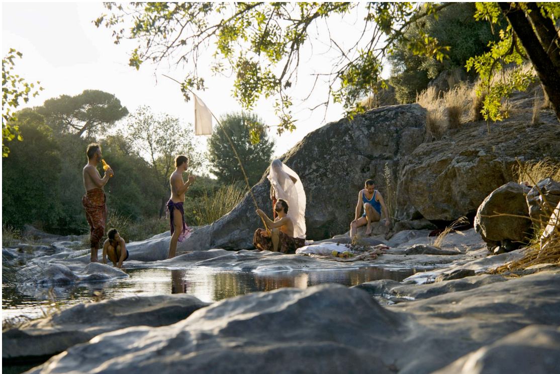
La zouze en résidence d'écriture à Montemor O Novo, Portugal, août 2008 - recherche chorégraphique et photographique 2 Fresh 2 Die (projet soutenu par la DMDTS).

Christophe Haleb s'intéresse à la notion d'espace en transition, il opère le passage de la création pour plateau à des lieux non conventionnels, sans les opposer les uns par rapport aux autres. Il marque l'aspect dynamique de chaque lieu, plus que la dimension statique de l'espace. Avec la convention du dispositif théâtral et l'esthétique de création in-situ, la zouze continue à mettre en jeu et à vérifier sa capacité à mettre en empathie l'objet proposé et son public, le contexte d'apparition et ses usages, d'activer la dimension kinesthésique de réception de l'œuvre, et l'émancipation du spectateur en chacun de nous.